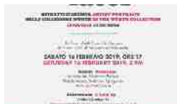
Art Faces. Ritratti d'artista nella Collezione Wurth" 16 Febbraio 2019 Articolo simile