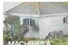
Machines à penser 26 Maggio 2018 Articolo simile